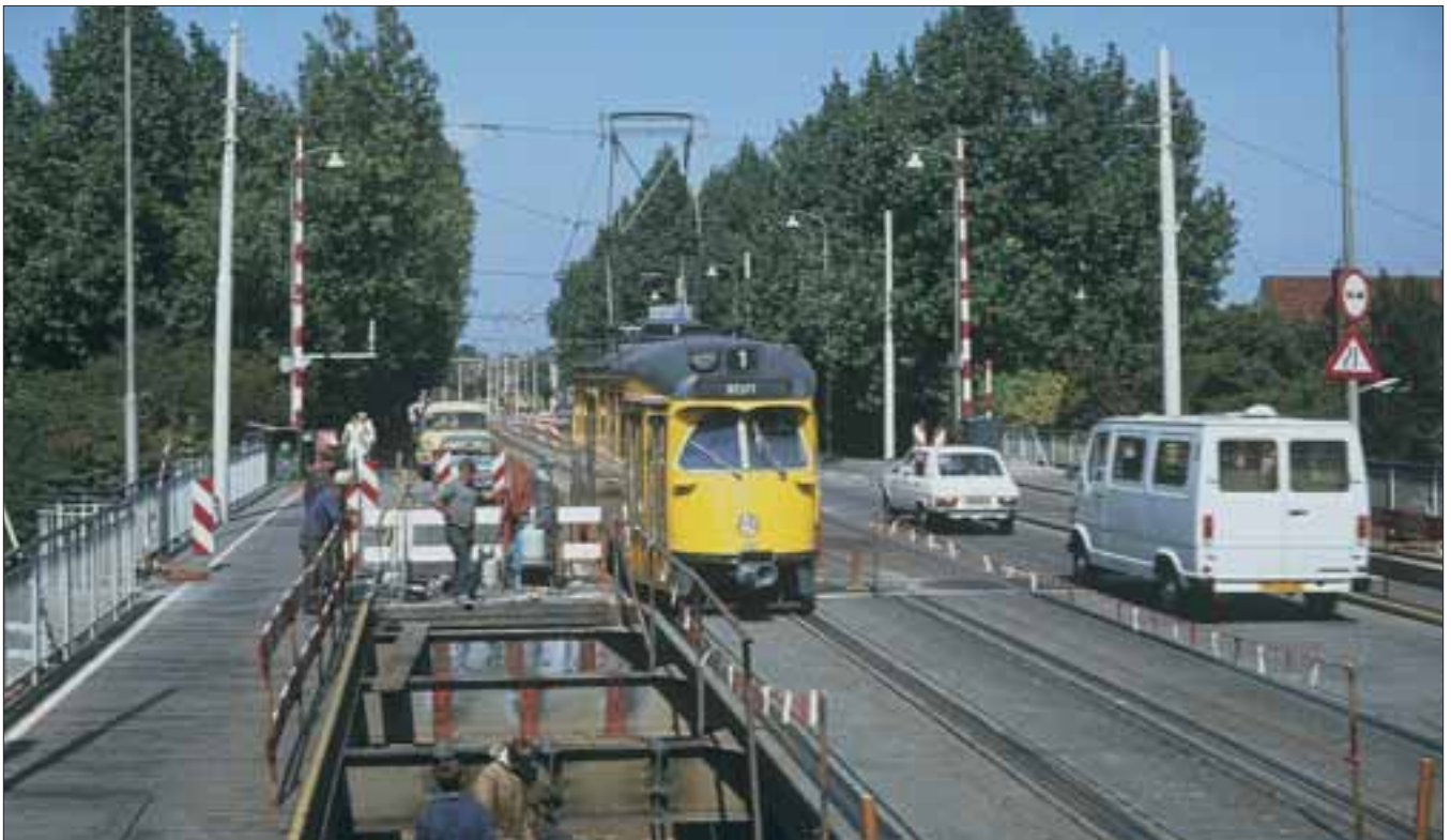
De Reineveldbrug kreeg in de periode 9 april t/m 1 oktober 1981 weer een opknopbeurt waarbij vanwege de afzetting direct naast de sporen kleinere PCC-cars serie 1101-1200 moesten worden ingezet. De 1141 zonder toeter op Reineveldbrug, 9 maart 1981.

De Reineveldbrug had na zijn grote renovatie in 1959 in 1981 weer zo'n beurt nodig, waarbij van 9 april tot en met 1 oktober 1981 enkelspoor op de brug werd gereden. Vanwege de komst van de dubbelgelede trams werd het eindpunt in Delft in juni 1983 met circa 12 m verlengd. Vanwege de verlenging naar Delft Zuid werd in januari 1994 dit eindpunt weer ingekort en ook het laatste wissel verwijderd.