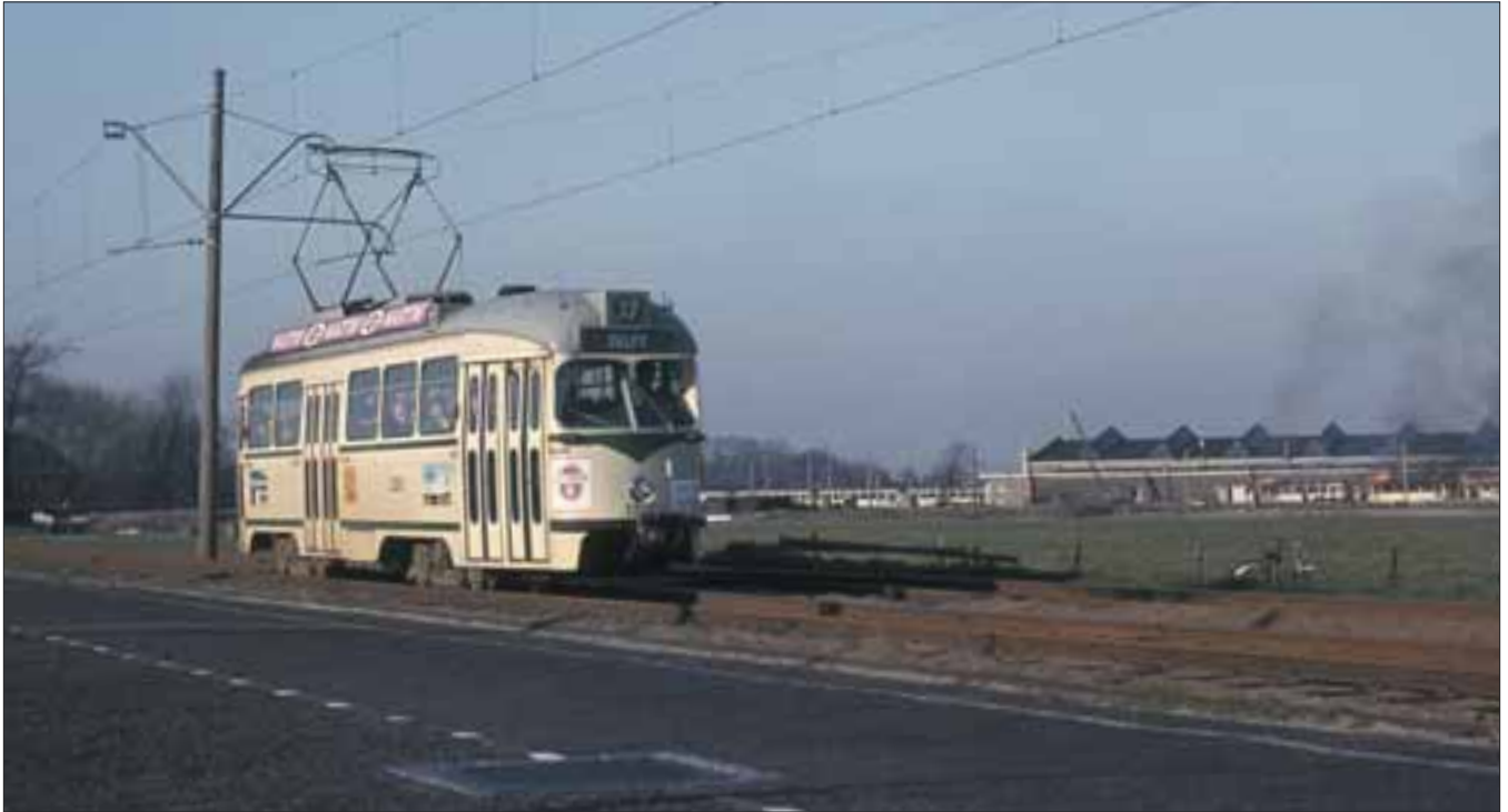
PCC-car 1210 van lijn 37 op de Delftweg bij Bouwlust in de eerste maanden van de exploitatie van de Delftlijn met PCC-cars met op achtergrond remise 's-Gravenmade waar op dat moment wagens van de stadsseries 801-830 en 751-780 werden gesloopt, 29 maart 1965.

burg, Leidsenveen en Ypenburg met Delft verbindt. Het is de bedoeling lijn 19 in 2017 vanaf de Westvest in Delft te laten rijden via de St. Sebastiaansbrug en de TU-wijk naar Delft Technopolis.