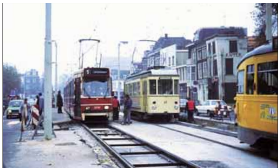
Na de verlenging van de Delftlijn als lijn 1 3 naar Scheveningen Noorderstrand werd het vanaf 5 augustus 1940 gebruikte eindpunt Turfmarkt opgebroken. Dubbelgelede tram 3018 van lijn 1 3 tijdens uitbreken van de aansluiting van de sporen op de Turfmarkt op die op het Spui, 11 november 1983.

In de nota Lijnennet 1976 had de HTM opgenomen lijn 1 3 in Den Haag te verlengen naar de keerdriehoek op het Korte Voorhout. Als reactie hierop pleitte de Werkgroep Openbaar Vervoer Agglomeratie Delft (WOVAD) voor verlenging van lijn 1 3 naar Delft-Zuid. Naar aanleiding daarvan legden B en W van