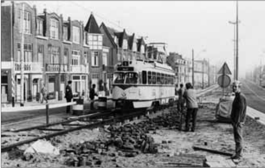
Het gedeelte Herenstraat – Hoornbrug van de Haagweg in Rijswijk kreeg in de zomer van 1969 hetzelfde bredere profiel als de Rijswijkseweg al sinds 1961 had en het overige gedeelte van de Haagweg sinds 1966. PCC-car 1208 van lijn 1 3 is 's-ochtends de eerste dienstwagen naar Delft die bij de Hoornbrug over het nieuwe spoor rijdt, 1 juli 1969.

van 1966 hetzelfde bredere profiel als de Rijswijkseweg al in 1961 had gekregen. In 1969 volgde het overige gedeelte van de Haagweg. Hierbij kwamen de sporen verder uit elkaar te liggen, een vrije baan voor de tram zat er toen niet in. Deze kwam er wel eind 1980 bij de volgende reconstructie, waarbij in het midden van de Haagweg zo'n baan kwam. Op de kruising met de Geestbrugweg kwam toen een voetgangerstunnel, waarbij tijdelijk een hulpbrug voor de tram naar Voorburg is gebruikt.