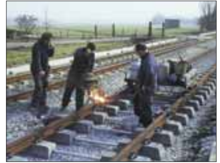
De trambaan langs de Delftweg werd in de jaren 1978-'80 in drie fasen vernieuwd. PCC-car 121.? rijdt over het al vernieuwde spoor richting Den Haag bij 's-Gravenmade, terwijl het spoor richting Delft wordt uitgebroken, 13 maart 1979. Het maken van een thermietlas tussen railstaven bij Driehuizen (Bouwlust), 20 maart 1979.

kade. Op het gedeelte van de Rijswijkseweg tussen Draaistraat en Broeksloot kwam in 1989 in het midden een vrije trambaan.