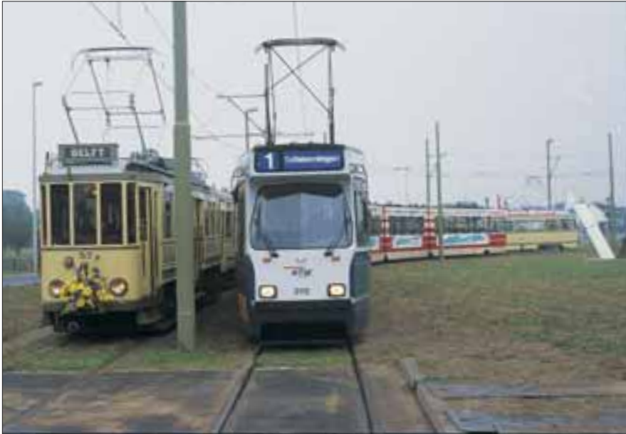
De verlenging van de Delftlijn naar Delft Tanthof werd feestelijk gevierd met de inzet van museumtrams, waaronder buitenlijnstel 57+118 en PCC-car 1210, staand naast de 3112 op eindpunt Tanthof, 26 augustus 1994.

was over de verlegging door de Plaspoelpolder. Deze kwam op 31 januari 1991, toen de wethouders van Den Haag, Delft en Rijswijk in een pakket onder meer een ander tracé via de Sir Winston Churchilllaan en Lange Kleiweg voor lijn 1 3 vaststelden met als alternatief door de Plaspoelpolder vanaf Burg. Elsenlaan via Visseringlaan naar de Lange Kleiweg. Toen bleek dat het pakket te duur was, werd in maart 1992 besloten lijn 1 3 niet te verleggen en slechts één nieuwe tramlijn 17 5 (Station Centraal – Wateringseveld) met een hoge hoed via de Visseringlaan in de Plaspoelpolder en Station Rijswijk aan te leggen. Deze lijn werd in twee gedeel-